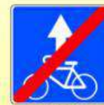
5.14.3. «Конец полосы для велосипедистов»