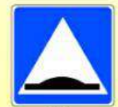
5.20. «Искусственная неровность»