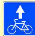
5.14.2. «Полоса для велосипедистов»