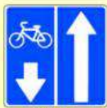
5.11.2. «Дорога с полосой для велосипедистов»