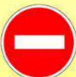
3.1 «Въезд запрещён»