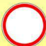
3.2 «Движение запрещено»