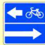
5.13.3. «Выезд на дорогу с полосой для велосипедистов»