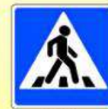
5.19.1. «Пешеходный переход»