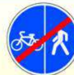
4.5.6. «Конец пешеходной и велосипедной дорожки с разделением движения (конец велопешеходной дорожки с разделением движения)»