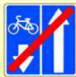
5.12.2. «Конец дороги с полосой для велосипедистов»