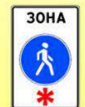
5.33 «Пешеходная зона»