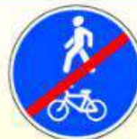
4.5.3. «Конец пешеходной и велосипедной дорожки с совмещенным движением»