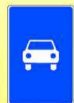
5.3 «Дорога для автомобилей»