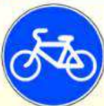
4.4.1. «Велосипедная дорожка»