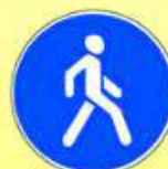
4.5.1 «Пешеходная дорожка»