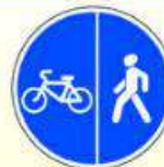
4.5.4. «Пешеходная и велосипедная дорожки с разделением движения»