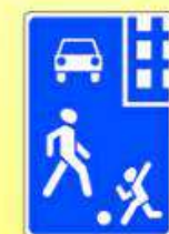
5.21 «Жилая зона»